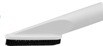
198873-4 Borstelzuigmond wit