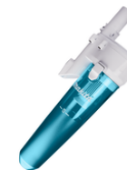
191D71-3 Cycloon voorafscheider wit