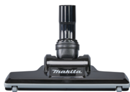
127828-2 Vloerzuigmond harde vloer zwart