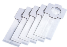
198745-3 Papieren stofzak steel- en auto