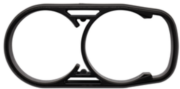
459038-6 Houder kierzuigmond zwart