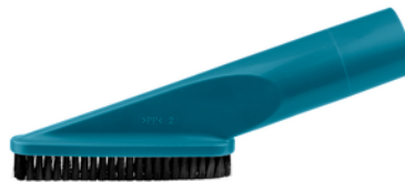
198538-8 Borstelzuigmond blauw