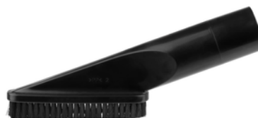
198540-1 Borstelzuigmond zwart